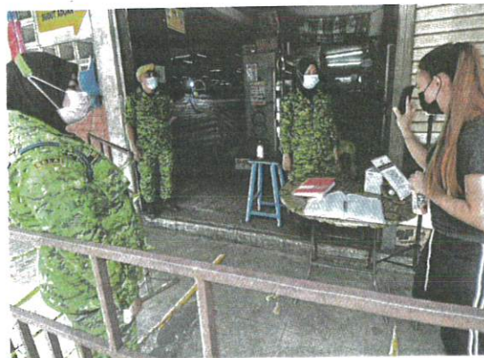
Rela personnel ensuring public compliance with the SOP in Kota Kinabalu yesterday.

"After the two female pupils were infected with Covid-19, 101 people, who are their schoolmates and teachers identified as close contacts, took the swab test.