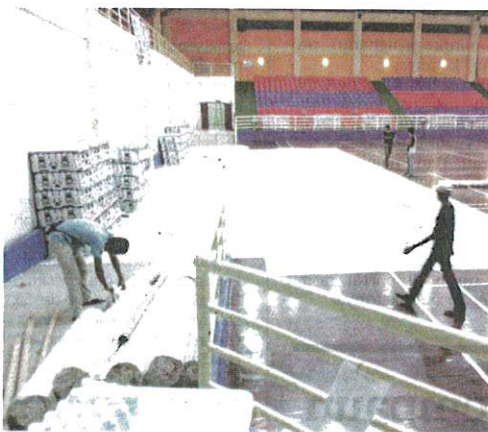
KERJA pembinaan Hospital Medan Tawau di Dewan Kompleks Sukan Tawau kini giat dilaksanakan.

"KKM akan terus mempertingkatkan usaha bersepadu dengan pelbagai pihak untuk menjayakan usaha membendung Covid-19," katanya.