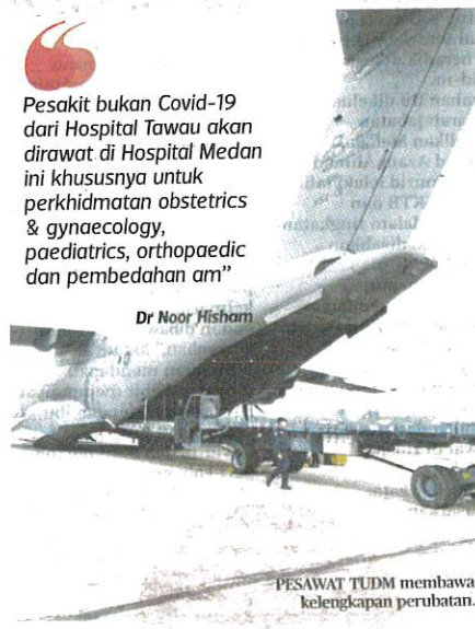
PESAWAT TUDM membawa kelengkapan perubatan.

Pesakit bukan Covid-19 dari Hospital Tawau akan dirawat di Hospital Medan ini khususnya untuk perkhidmatan obstetrics & gynaecology, paediatrics, orthopaedic dan pembedahan am "