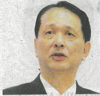
DR. NOOR HISHAM ABDULLAH

Katanya, sebelum ini Kementerian Kesihatan mengesyaki