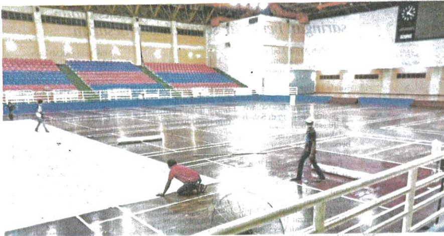
KERJA persiapan untuk mewujudkan Hospital Medan giat dilakukan di Dewan Kompleks Sukan Tawau, Sabah, semalam.