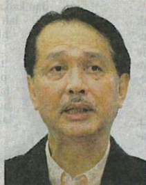
DR NOOR HISHAM

sia (KKM) semalam. Menurutnya, sebanyak 589 kes baharu positif Covid-19 dikesan di seluruh Malaysia menjadikan jumlah keseluruhan kes adalah 18,129 dengan 5,945 kes aktif. "Jika dilihat pecahan utama jumlah kes hari ini (semalam), Sabah masih mencatatkan jumlah kes tertinggi iaitu sebanyak 304 kes. "Secara keseluruhan, sebanyak 91 kes yang dilaporkan hari ini (semalam) terdiri daripada Kluster Tembok, Kluster Penjara Reman dan Kluster Penjara Seberang Perai. Kes-