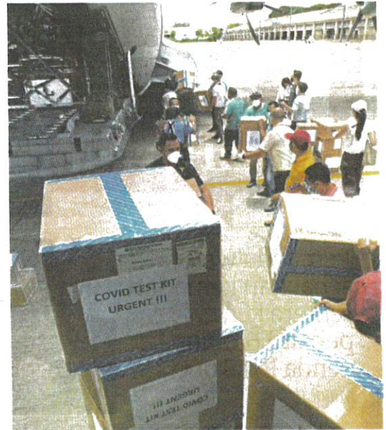
Stok kit ujian RTK-Antigen tiba di Sabah bagi melakukan saringan COVID-19 dan memperoleh keputusan lebih cepat.