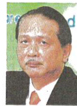
Tan Sri Dr Noor Hisham Abdullah

The index cases of Olive, Bah Pasir and Bah Pengkalan clusters were identified from screening those returning from Sabah.