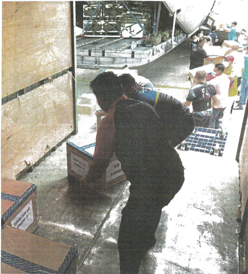
The Royal Malaysian Air Force transporting new rapid test kit antigen to Sabah.

AKHBAR : NEW STRAITS TIMES MUKA SURAT : 3 RUANGAN : NEWS/STORY OF THE DAY