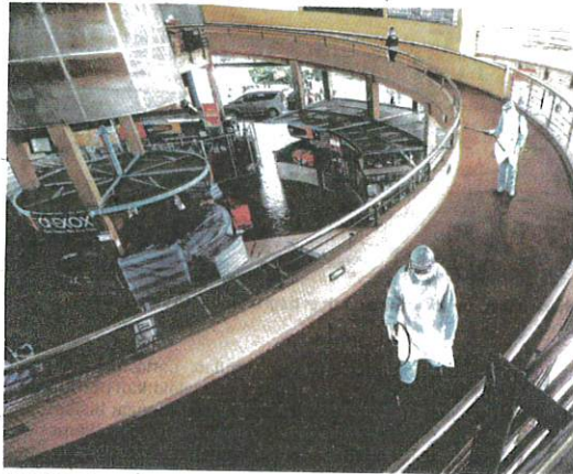
ANGGOTA bomba melakukan proses sanitasi di Pasar Awam Presint 8, Putrajaya semalam.

"Virus Covid-19 di Sabah dikesan mempunyai mutasi D614G yang datang dari Filipina dan Indonesia. Institut Penyelidikan Perubatan (IMR) telah